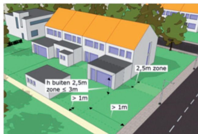
Buiten de 2,5 meter zone

Als er door de bouw van een bijbehorend bouwwerk een ruimte ontstaat die de 2,5 meter zone overschrijdt, dan geldt voor die gehele ruimte de eis van een ondergeschikt gebruik. Alleen als de ruimte binnen of ter hoogte van de 2,5 meter zone wordt afgescheiden met een scheidingsconstructie (muur of pui), kan de ruimte gebruikt worden voor de uitbreiding van de primaire functie van het hoofdgebouw, bijvoorbeeld als woonkamer.